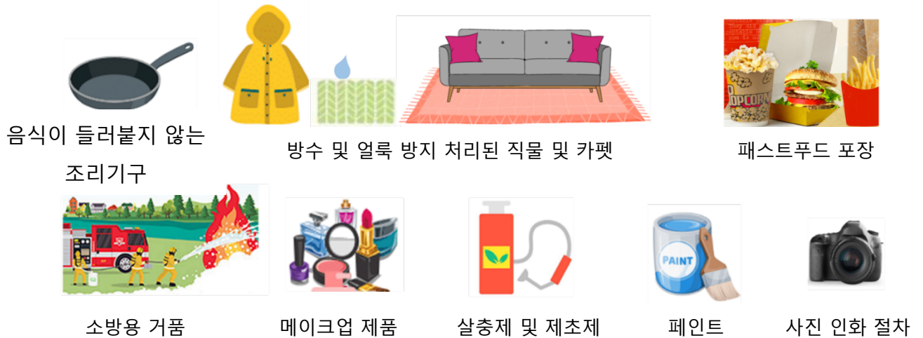
그림 1. PFAS가 포함된 소비자 제품의 예.

PFAS의 주요 발생원은 화재 훈련 및 화재 대응 현장, 산업 현장, 매립지, 폐수 처리장 및 바이오 고형물입니다. 다음 그림은 PFAS가 포함된 제품의 예를 보여줍니다.