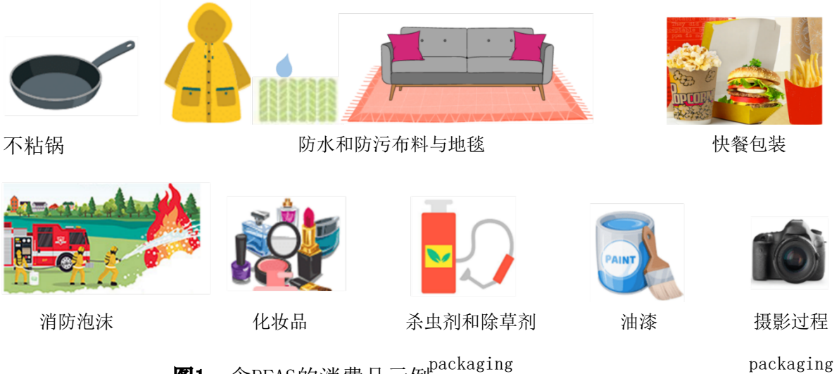
图1. 含PFAS的消费品示例。 packaging

PFAS的主要来源有：消防训练/消防响应场地、工业场地、垃圾填埋场和废水处理厂/生物固体。以下图片显示了部分含有PFAS的产品。